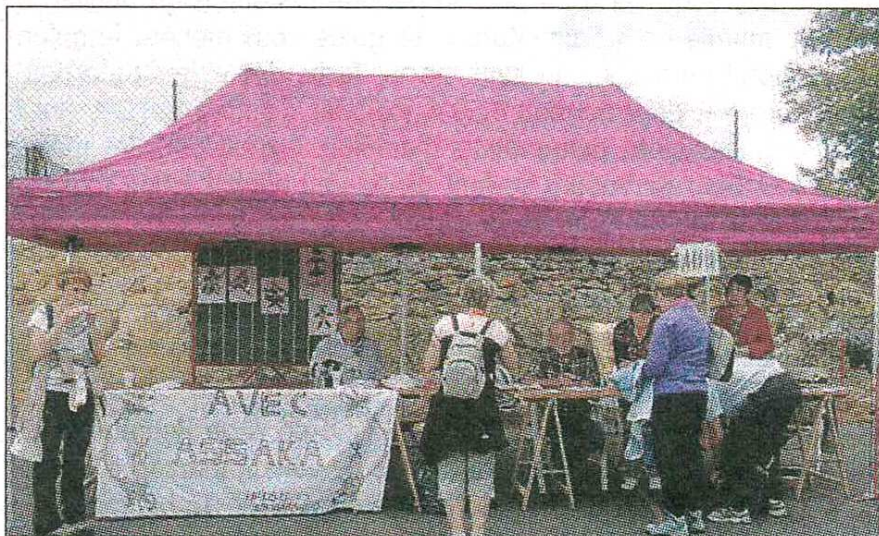
RAVITAILLEMENT. Un moment important pour les randonneurs afin de parcourir les chemins en pleine forme.

La randonnée solidaire, organisée par Avec Assaka, dimanche dernier a réuni 170 participants. Cette année, c'est sous le soleil et sur des chemins secs qu'ils ont parcouru les kilomètres.