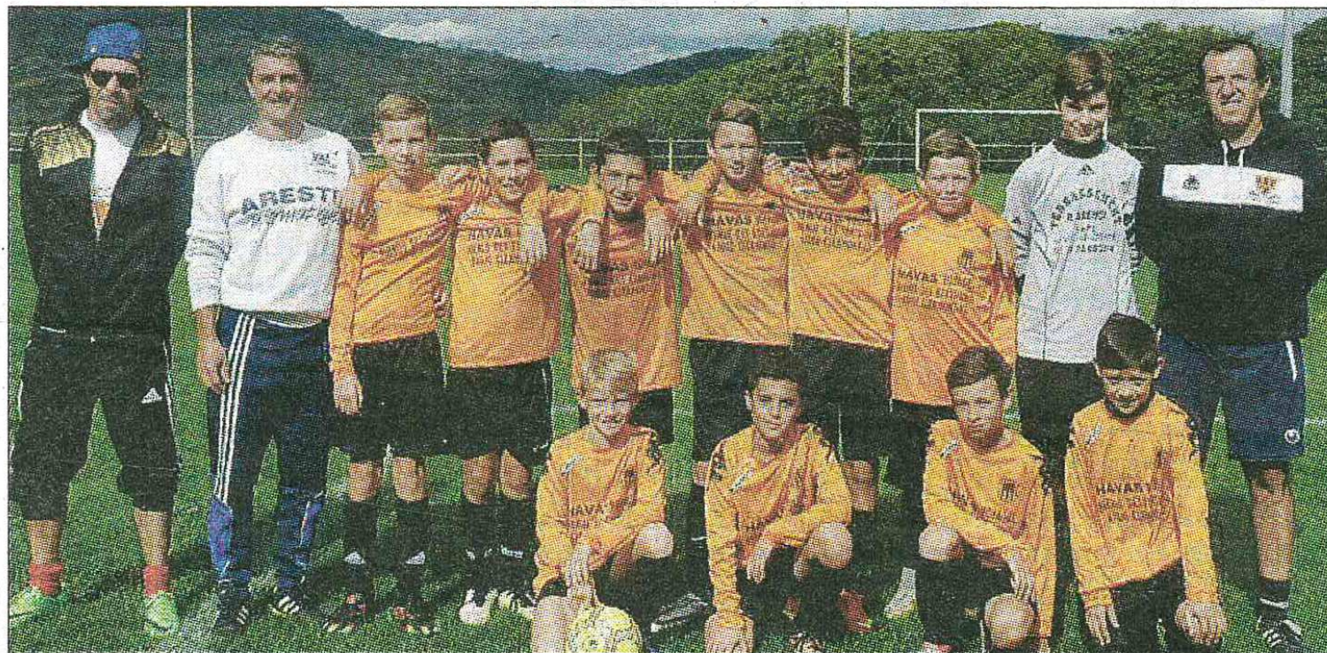
EXPLOIT. Les jeunes U13 A sont allés chercher une très belle victoire à Cébazat : 0 - 13.

Samedi 15 octobre : U13A et U13B à 14 h 30 à