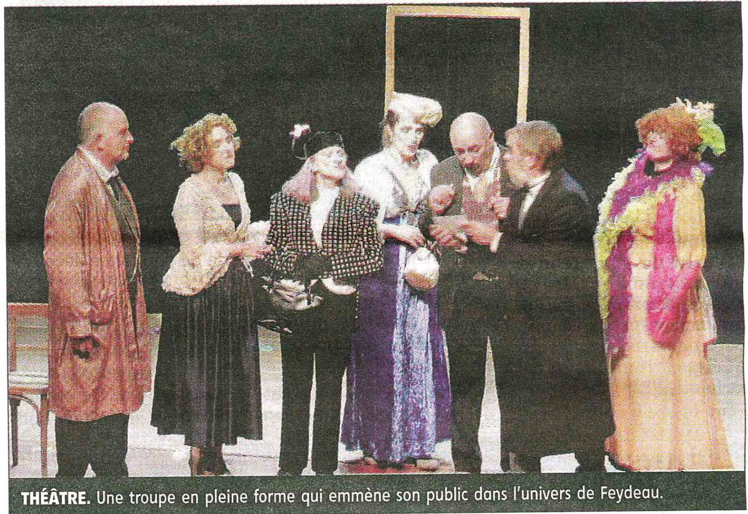
THÉÂTRE. Une troupe en pleine forme qui emmène son public dans l'univers de Feydeau.

Fort d'une soixantaine de spectateurs, le public a beaucoup ri et salué la prestation par de copieux applaudissements. La soirée s'est prolongée autour du pot de l'amitié. ■